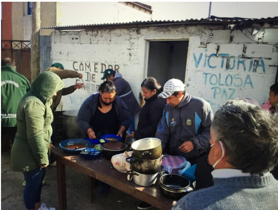
Fig. 3. Cantine « Los Carreros »

qui, dans des situations de vulnérabilité, tentent de fournir une forme de normalité face au (dés)ordre alimentaire. Nous analyserons les perceptions des responsables des cantines communautaires en tant que médiateurs de différents contextes et scénarios d'aide alimentaire. Nous nous appuyons principalement sur une étude de cas d'un quartier de la ville de La Plata 3 , mais en nous permettant également certaines généralisations sur l'intervention alimentaire, à partir de cet exemple concret. Ainsi, nous considérons, comme axe central d'analyse, que l'espace du quartier se constitue par rapport aux cantines comme lieux de vie quotidienne favorisant les liens politiques et sociaux, établissant ce que nous appelons « l'ordre » possible au sein du quartier. Ces dimensions (voisinage, sociabilité et aide alimentaire) de l'espace du quartier ont été intégrées dans les observations et les visites du quartier, établissant les zones d'influence et d'extension de chaque cantine. La dimension de la spatialité est ainsi récupérée comme la possibilité de consolider un ordre alimentaire de quartier déployé et représenté par les cantines et leurs gestionnaires.