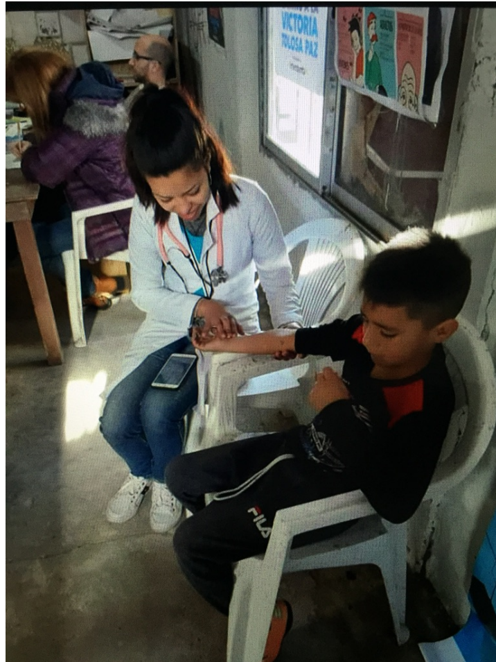
Fig. 7. Cantine « Los Carreros »

Certains soins médicaux sont également prodigués.