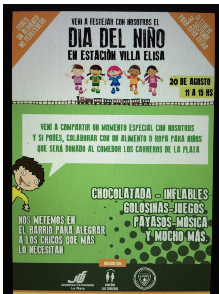
Fig. 5. Affiche de l'association « Comedor Los Carreros de La Plata » publiée à l'occasion de la « Journée des enfants »

identifié certaines zones de plus grande influence en fonction de la connaissance mutuelle entre voisins et de leurs propres trajectoires dans le quartier. L'analyse de l'espace constitué au sein du quartier et des médiations et activités quotidiennes des responsables des cantines peut être repensée à partir des enjeux de l'espace social, des asymétries du pouvoir social et de la distribution du capital tels que présentés dans les travaux de Bourdieu 5 et d'autres auteurs comme une perspective relationnelle pour reconnaître et analyser ce champ déterminé en termes d'intervention alimentaire des cantines. De ce point de vue, la considération des actions des sujets sociaux, jugées raisonnables et donc raisonnées, se présente à partir d'un certain positionnement, qui surgit dans leur vie quotidienne et entre dans le cadre de ce que nous avons appelé leur spatialité au sein de l'ordre alimentaire du quartier.