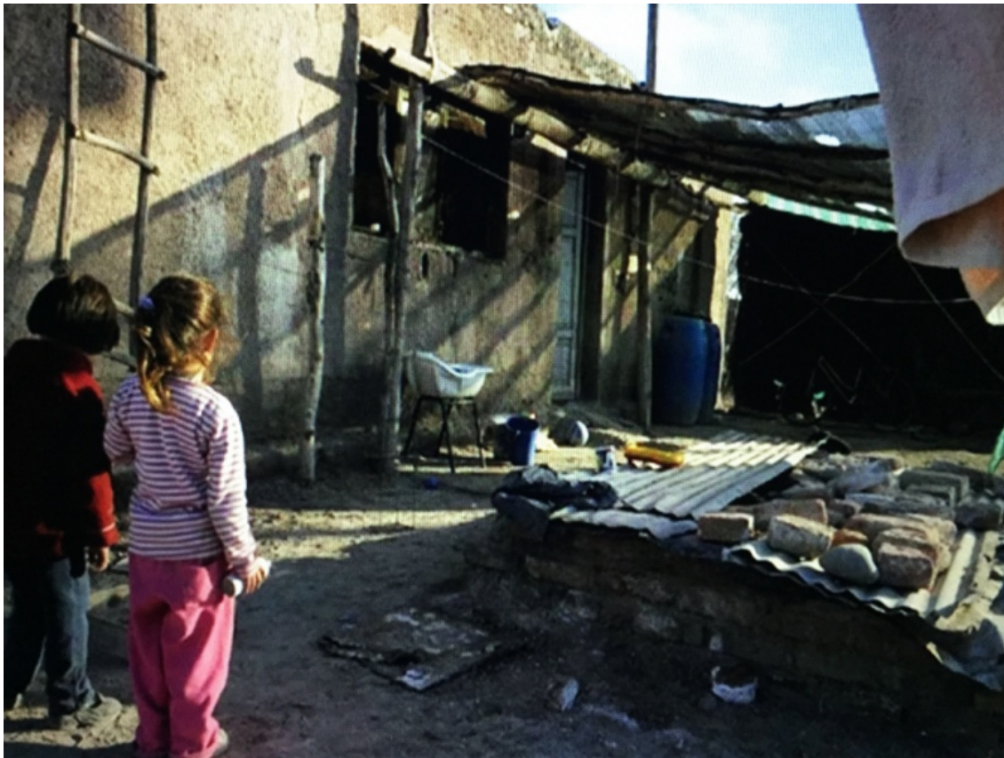
Fig. 1. Zone pauvre de Villa Elisa (localité située à 15 km du centre de La Plata et à 45 km de Buenos Aires)

Fin 2020, 65 % des moins de 17 ans vivaient dans des foyers pauvres, https://www.villaelisaaldia.com.ar/ampliada.php?cual=informacion_general&id=6010