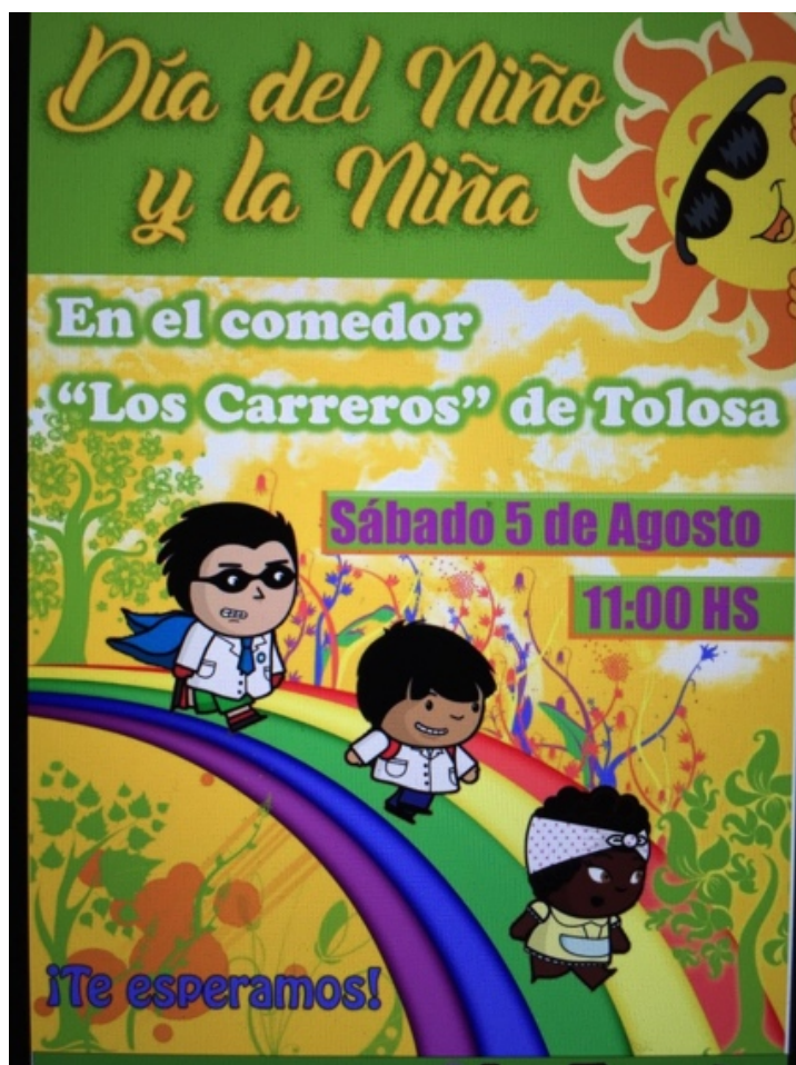
Affiche publiée à l'occasion de la « Journée des enfants ».