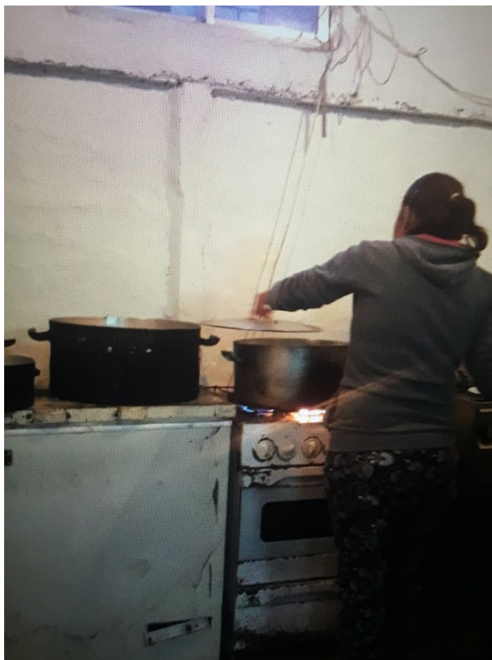
Fig. 2. Cantine populaire « Centro Recreativo y comedor Los Carreros », Calle 122 y 521, quartier de Tolosa, La Plata, Argentine

Préparation du repas. (Toutes les photos du centre « Los Carreros » proviennent de leur page Facebook :