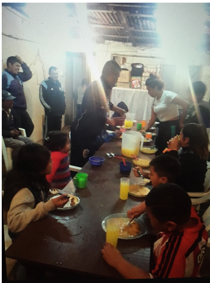
Repas servi à table.