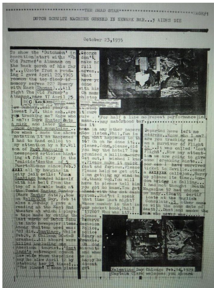
Exemple de texte en colonnes rédigé depuis New-York par Burroughs. Il s'agit ici d'une variation sur le thème des derniers mots du mafieux Dutch Schultz, qui fascinaient alors Burroughs.