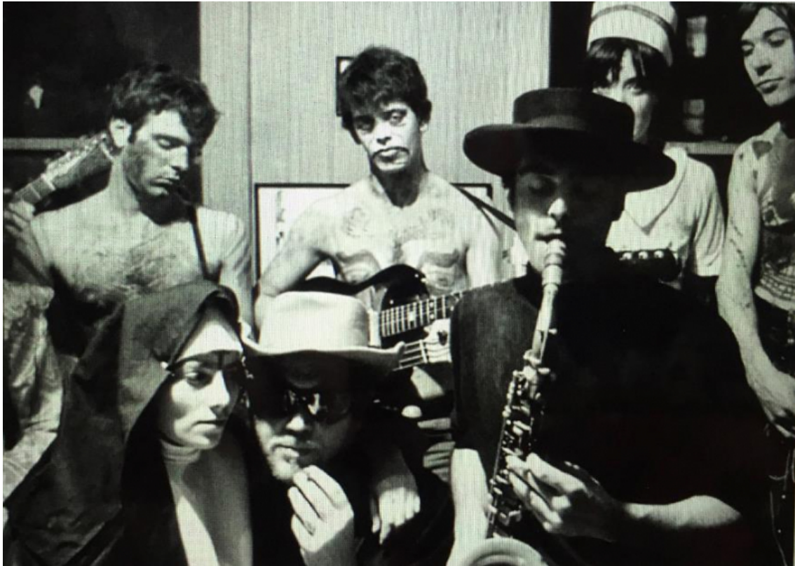
Heliczer au saxophone, en compagnie du Velvet Underground, alors inconnu, lors d'une soirée DREAMWEAPON.