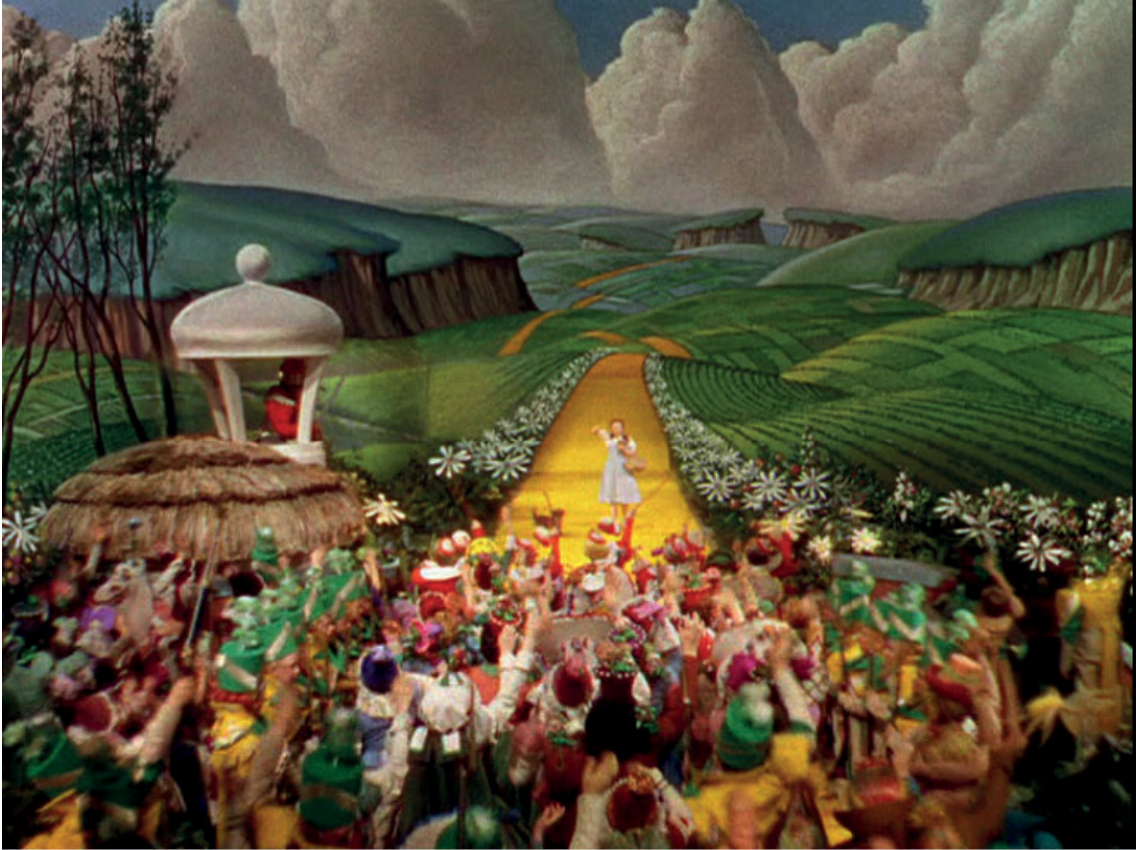
Fig. 3: Victor Fleming, The Wizard of Oz , Metro-Goldwyn-Meyer et Loew's Incorporated, 1939.

Comment sous-titrer le sémantisme suggéré d'une œuvre audiovisuelle ?