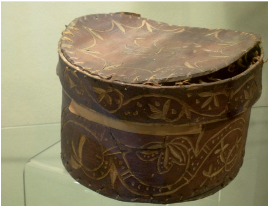
Fig. 1 : boîte mohegan en écorce d'orme, réalisée par Samson Occom et les Indiens convertis de Brothertown, envoyée à Lucy Occom Tantaquidgeon dans les années 1780-90.

(photo de l'auteur, Tantaquidgeon Indian Museum, Uncasville, Connecticut, mai 2016)